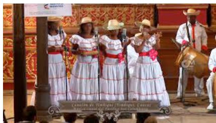
FESTIVAL DE MUSICA RELIGIOSA DE MARINILLA