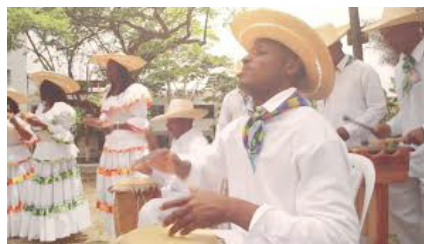
MOLINO MI MOLINETE