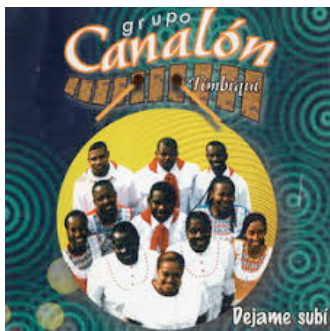
DEJAME SUBI 2006