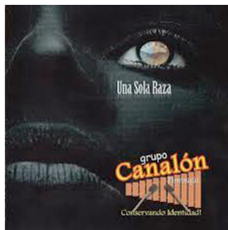
UNA SOLA RAZA 2011