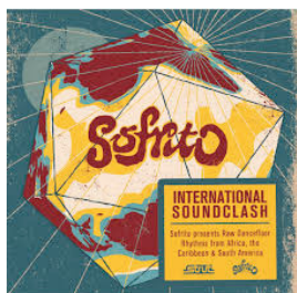
SOFRITO SOUNDCLASH SOFRITO RECORDS 2012 - London, UK