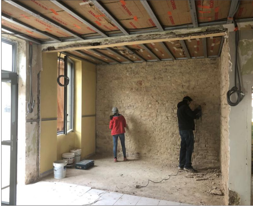
Zutique productions fait appel aux bonnes volontés pour l'ouverture prochaine de son tout nouveau lieu culturel, Au Maquis - espace naturel des imaginaires. Des chantiers participatifs sont organisés les week-ends des 19 et 20 mars, 9 et 10 avril, 7 et 8 mai, 11 et 12 juin.

« Les tâches seront assez variées et dépendront de la météo », explique Salomé Joi-