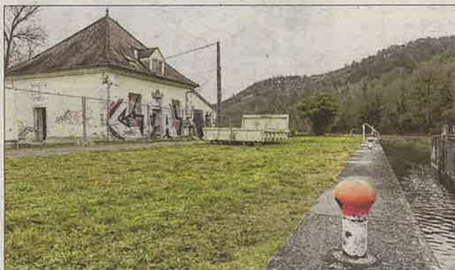
Le Maquis va accueillir des projets d'insertion.

« Nous travaillons beaucoup avec des structures telles que l'Acodège, la Sdat, l'École de la deuxième chance, le projet Ensemble ! du Cesam, ayant pour mission l'accompagnement et l'intégration des réfugiés », explique le responsable de Zutique productions. « Dans le cadre de ces travaux, nous avons prévu de mettre en place des chantiers collectifs avec des structures d'insertion, qui vont être programmés à partir du mois de mars. » Et d'ajouter : « L'été prochain, il est prévu de bâtir une construction modulaire en bois pour en faire un lieu de résidence artistique. Ce projet sera le tremplin d'un chantier collectif... ». De mé-