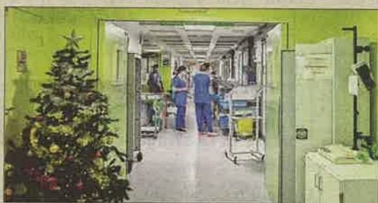
PAGES 2 ET 3