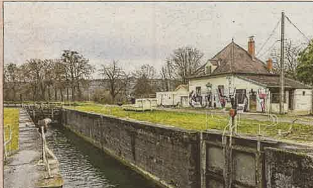
La maison éclusière 51 S, écluse de Bruant, va complètement changer de vocation.

« Le Maquis », un nouveau lieu culturel et artistique, devrait ouvrir ses portes courant juin, le long du canal de Bourgogne, à proximité du lac Kir, en limite des communes de Dijon et de Plombières-lès-Dijon. Au menu de ce nouveau lieu original, qui sera précisément situé à la maison éclusière 51 S : de la restauration, des concerts et des expositions, des résidences et des pratiques artistiques.