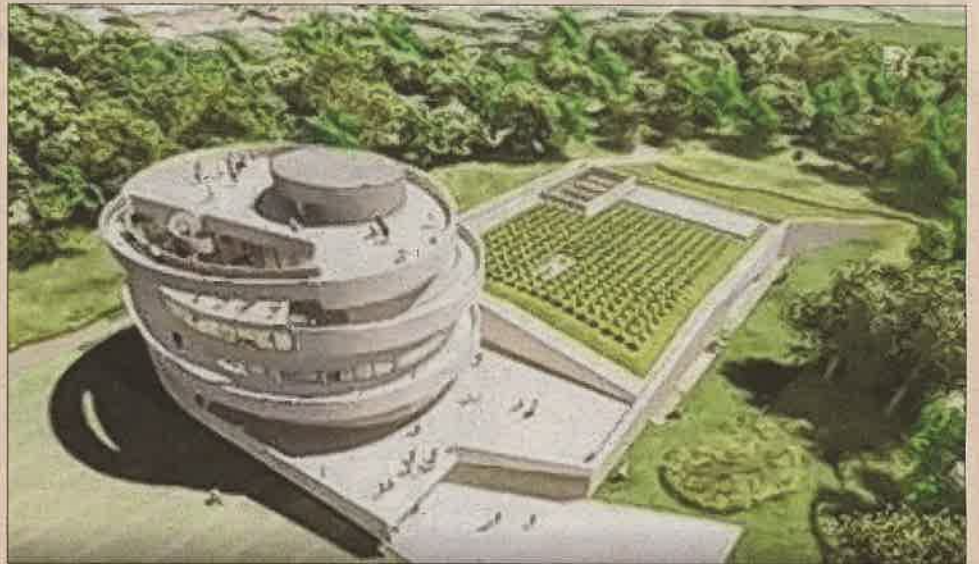
Une des projections du résultat final. Visuel Groupement Rougeot - SIZ-IX Arc

La Cité des Climats et des vins de Bourgogne, à Beaune, devrait être inaugurée en novembre. « [Elle] accueillera les œnophiles pour une expérience unique à partir de 2023. À Beaune, trois espaces donneront les clés de l'univers "Vins de Bourgogne" », présentent les responsables du projet. « La Cité sera un lieu d'information et d'expériences basé sur une approche pédagogique et sensorielle. »