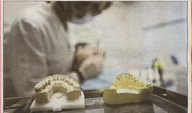
Pour l'Agence régionale de santé, « c'est l'aboutissement d'un travail partenarial engagé depuis plusieurs années ».

À la rentrée 2022, les universités de Bourgogne et de Franche-Comté devraient assurer une formation en odontologie. Les deux universités seront co-accréditées pour proposer cette formation complète portée par un département d'odontologie commun et partagé au sein des UFR (unités de formation et de recherche) de santé de Besançon (Doubs) et de Dijon. Ce type de formation manquait localement.