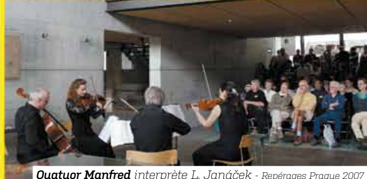
Quatuor Manfred interprète L. Janáček - Repérages Prague 2007