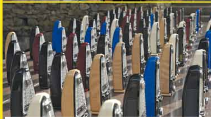
Symphonie pour 100 Métronomes - G. Ligeti - Repérages Budapest 2005

Dimanche 14 août | 15h00 Cinéma de Luzu FÊTE DE L'ACCORDÉON À LUZY CONCERT DE MARC EGEA ET CATI PLANA Plus d'informations sur www.fetedelaccordeon.com Vendredi 30 septembre | 20h00 Maison du Beuvray à Saint-Léger-sous-Beuvray CONCERT AVEC L'ENSEMBLE DE SOLISTES ARTEMIS « MUSICIENS FRANÇAIS À L'HEURE ESPAGNOLE » Plus d'informations sur www.maisondubeuvray.com