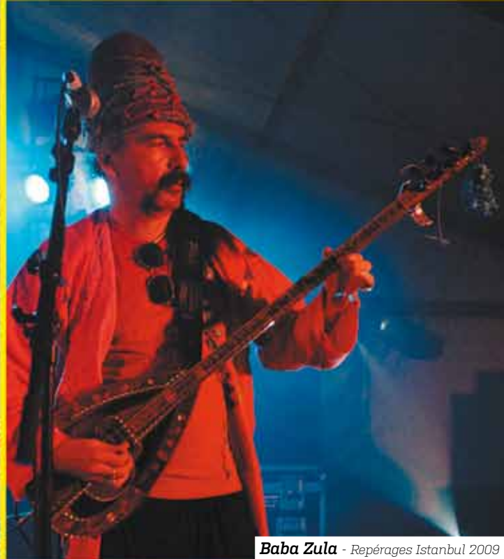
Baba Zula - Repérages Istanbul 2009